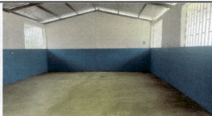
Vista interior de la bodega escolar construida.