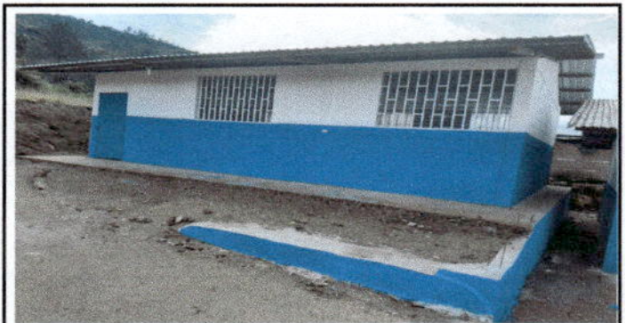
Vista de frente muro perimetral de la bodega escolar construida.

Observación: Si es necesario se pueden agregar hojas adicionales actualizando el número de hojas.