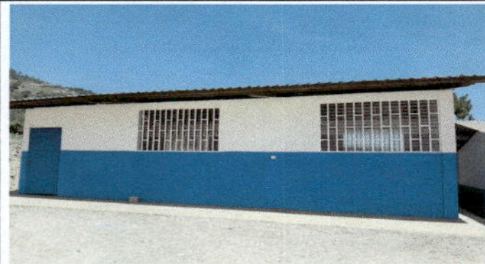
Vista de frente de la nueva bodega escolar construida.