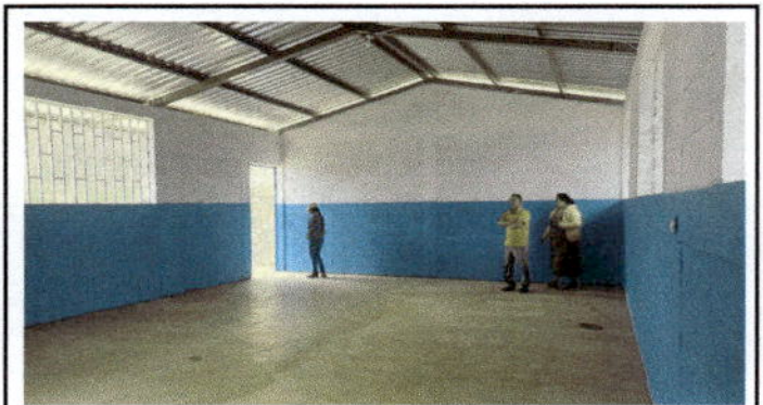
Instalación de energía eléctrica interior de la bodega escolar construida.